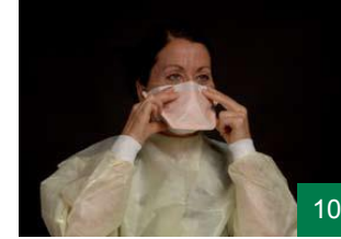
10 دەمامکەکە وا ریک بخە کە هەست بکەیت خۆش و ئاسووده لەسەر دەموچاوت دانراوه.