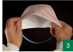
3 دەمامکەکە پیچەوانە بگرە بۆئەوهی پەتەکانی بکەوێتە دەستت.