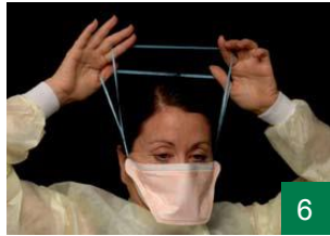
6 پەتەکان بەخە دەوری سەرت.