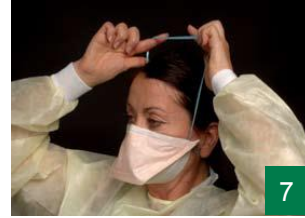
7 پەتەکی سەر وه له پشت مل و بن گویت دابنن.