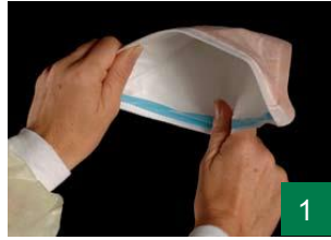
1 گۆشەکانی دەمامک جیا بکەرە بۆئەوهی بکرینتەوه.