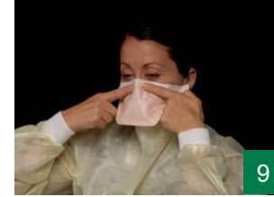
9 تەلی پێشەوهی دەمامک بەهێمنی گوشار بده بۆئەوهی بکەوێتە سەر لوونت و قایم بیت.