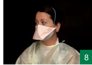
8 پەتەکانی سەر وه لهسەر سەرت دابنن وهها کە ریک له پێشەوهی گویت بیت.