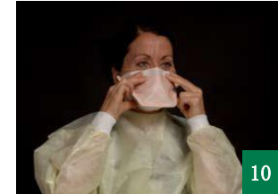
10 继续调整面罩和边缘，直到你感觉佩戴良好舒适