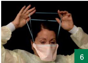
6 将松紧带往上拉到头后方