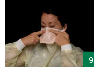
9 沿着鼻梁轻压鼻梁钢丝，直到贴合