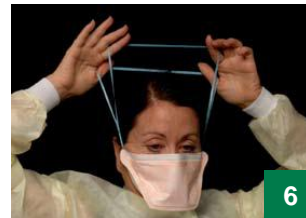
6 ទាញខ្សែចងឡើងលើហើយដាក់ពីលើក្បាលអ្នក