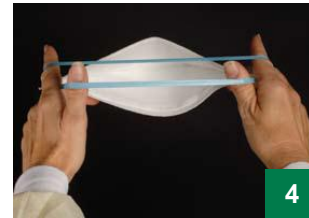
4 ញែកខ្សែពីរចេញពីគ្នាដោយប្រើម្រាមដៃចង្កុល និងមេដៃអ្នក