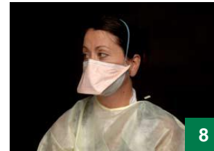
8 ដាក់ខ្សែចងផ្នែកខាងលើកំពូលក្បាលអ្នក ដើម្បីឲ្យខ្សែនោះនៅចំពីលើត្រចៀកអ្នក