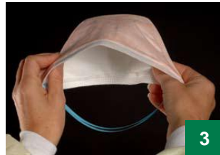
3 កាន់ម៉ាសបញ្ជ្រាសដើម្បីឲ្យឃើញខ្សែចងពីរ