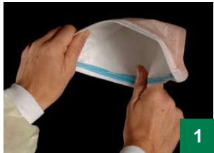
1 ញែកតែម៉ាសចេញពីគ្នា ដើម្បីឲ្យវាបើកបានពេញ