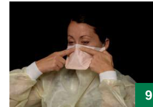
9 សង្កត់ខ្សែលូសច្រមុះម៉ាសជ្រមុជកាត់តាមខ្នងច្រមុះអ្នក រហូតទាល់តែពាក់វាបានត្រឹមត្រូវ