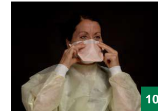
10 បន្តកែសម្រួលម៉ាស និងតែម៉ាសរហូតទាល់តែអ្នកមានអារម្មណ៍ថាពាក់បានស្រួល និងត្រឹមត្រូវ