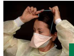
7 ដាក់ខ្សែចងផ្នែកខាងក្រោមនៅគល់កញ្ចឹងកអ្នក