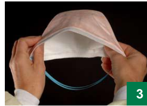
locnī wicde piny ke höö bī depke dan rēw jōc