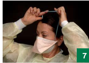
Ku dep in te piny goan guääkdu ke thar jīthnī