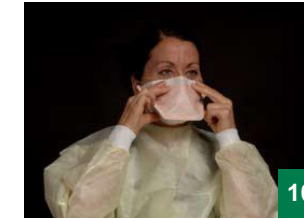
Kue hōn ke rialikā amānī mī ce cap a goaa εn kuum ε cī guic ce cu goaa ke lat