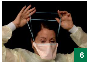
Ku depke thōt wīcdu