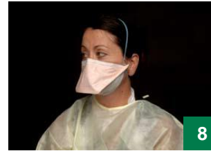
Gōnī dep nhial dääru ke höö be we ke wic jīthnīku