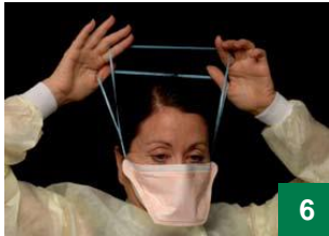
6 သိုင်းကြိုးများကို အပေါ်ဖက်နှင့် ခေါင်းပေါ်သို့ ပင့်တင်ပါ။