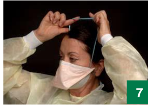
7 အောက်ဖက်မှသိုင်းကြိုးကို သင့်ဂုတ်ပိုး အောက်ခြေ (နှားရွက်များအောက်တွင်) နေရာချပြီး နေသားကျအောင် ထားပါ။