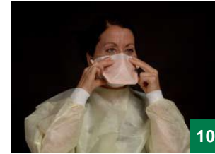
10 နှာခေါင်းစည်းနှင့် အစွန်းများကို သင် သက်တောင့်သက်သာစွာ ရှိသည်အထိ ဆက်ပြီး ညှိပါ။