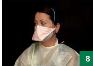
8 အထက်ဖက်မှ သိုင်းကြိုးကို သင့်ဝယ်ထိပ် အပေါ်တွင် သင့်နှားရွက်များ၏ ထိပ်သို့ ဆင်းလာစေရန် နေရာချပါ။