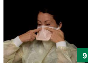
9 နှာခေါင်းပေါ်မှ ဝါယာကြိုးကို နှာခေါင်းအစိုး အပေါ်သို့ သက်တောင့်သက်သာစွာ နေရာကျစေရန် ဖြည်းဖြည်းဖိပါ။