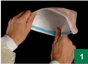
1 နှာခေါင်းစည်းကို ပွင်းသွားစေရန် အစွန်းများကို ချလိုက်ပါ။