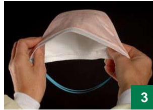
3 သိုင်းကြိုးနှစ်ခု ပေါ်လာစေရန် နှာခေါင်းစည်းကို ဖောက်ထိုးထားပါ။