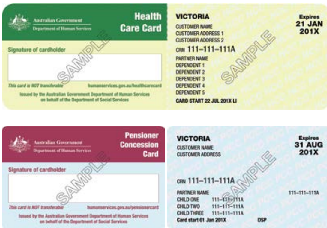
图1：VPTAS批准的各种优惠卡

经批准的主要持卡人，其个人信息写在养老金领取者优惠卡或医疗保健卡的左上角（下列表1中的顾客姓名）。罗列在养老金领取者优惠卡或医疗保健卡上的其他人（伴侣、受扶养者或孩子）不是经批准的主要持卡人。在这些情况下，非优惠卡持有者政策将被采用。