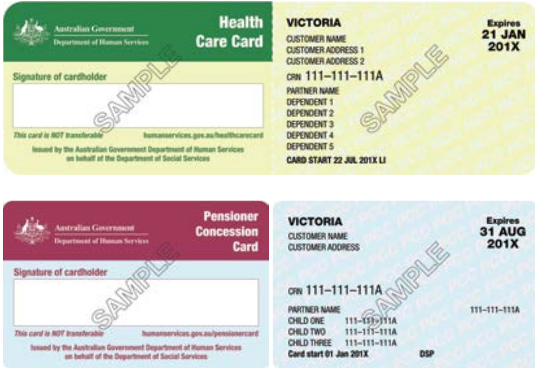
Şekli 1: VPTAS-onaylı indirim kartları

Onaylı bir kartın ana sahibi, bir emeklilik indirim kartı veya sağlık bakım kartının sol üst köşesinde ayrıntılandırılan kişidir (aşağıdaki 1'inci şekilde görülen müşteri adı). Bir emeklilik kartında veya sağlık bakım kartında sıralandırılan ek kişiler (eş, bağımlı kişiler veya çocuklar) onaylı ana kart sahipleri olarak tanınmaz. Bu gibi durumlarda indirim içermeyen kart sahiplerine ilişkin politika uygulanır.