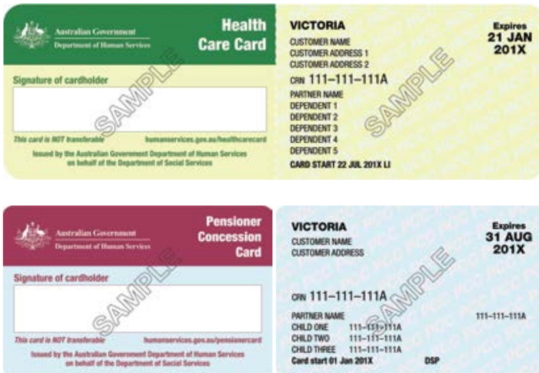
Εικόνα 1: κάρτες μειώσεων εγκεκριμένες από το VPTAS

Εγκεκριμένος πρωτοβάθμιος κάτοχος κάρτας είναι το άτομο που αναγράφεται στο πάνω αριστερό τμήμα μιας κάρτας μειώσεων συνταξιούχων ή κάρτας υγειονομικής περίθαλψης (Όνομα πελάτη στο σχήμα 1 παρακάτω). Τα επιπλέον άτομα που αναγράφονται σε μια κάρτα μειώσεων συνταξιούχων ή κάρτας υγειονομικής περίθαλψης (σύντροφος, εξαρτώμενα άτομα ή παιδιά) δεν αναγνωρίζονται ως εγκεκριμένοι πρωτοβάθμιοι κάτοχοι κάρτας. Σε αυτές τις περιπτώσεις θα εφαρμόζεται ο κανονισμός για κάτοχο κάρτας χωρίς μειώσεις.